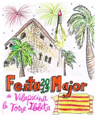
Dibuix guanyador pel cartell de 2019

Doncs tot a punt per a començar !! Som-hi, us esperem a tothom !! Participem dels 8 dies intensos de Festa Major !!